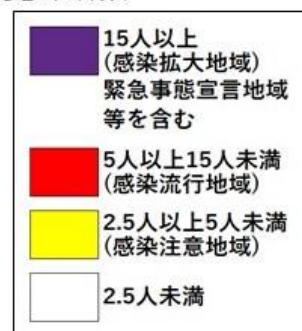
直近1週間の人口10万人あたりの新規感染者数