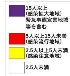
直近1週間の人口10万人あたりの新規感染者数