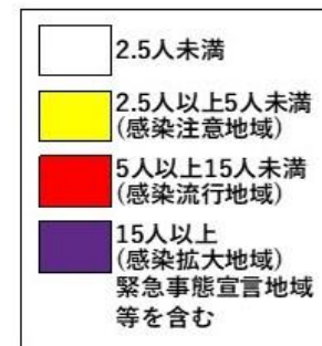
直近1週間の人口10万人あたりの新規感染者数