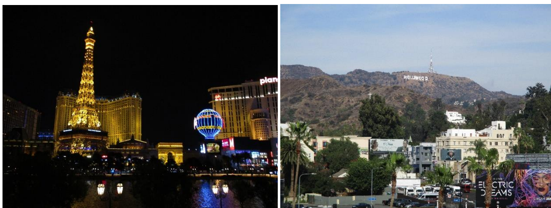
図 夜のラスベガス（パリもどき） ← →ハリウッド

こちらにくる留学生のほとんどが冬休みを利用して彼らの自国に帰ったので、同じ派遣留学生らと西海岸に旅行に行きました。年明け前からニューヨークシティに 10 日程ホームステイをしたのち、サンフランシスコ→ラスベガス（&グランドキャニオン）→ロサンゼルスと旅行しました。地図で見れば近いけど実際には移動が数時間かかったり、国内でも時差が 3 時間あったり（ちなみに、アメリカ国内でタイムゾーンが複数あるので、テレビで複数回年越しカウントダウンが楽しめる）とアメリカの広大さに改めて驚かされました。同じ都市内でも車で移動しなければどうしようもならない距離なので、旅行中の Uber の便利さには感服する一方でした。