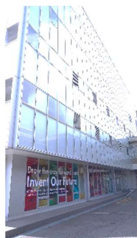
Beyond SDGs 推進センター (外観)