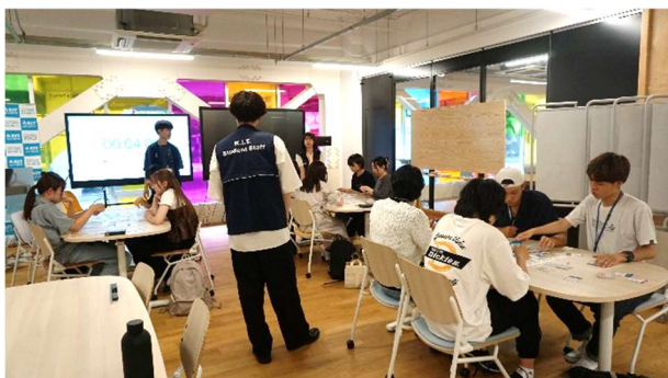
学生スタッフによるイベント運営