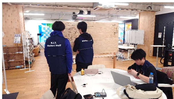
学生スタッフ同士での業務ミーティング